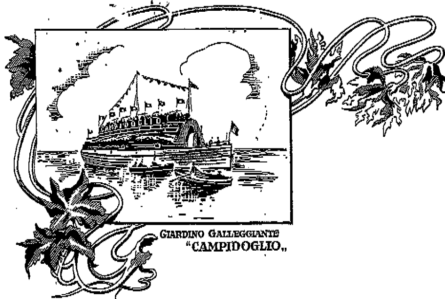
GIARDINO GALLEGGIANTE "CAMPIDOGGIO."